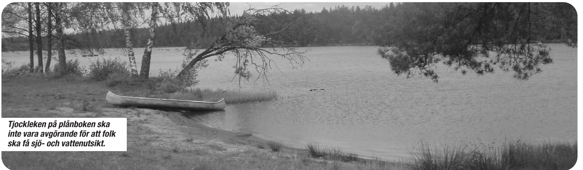
Tjockleken på plånboken ska inte vara avgörande för att folk ska få sjö- och vattenutsikt.

★ Vi säger ja till turistsatsningar på Isaberg men nej till en inbyggd skidbacke!