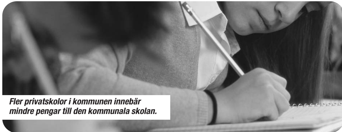
Fler privatskolor i kommunen innebär mindre pengar till den kommunala skolan.

Resultatet blir att privatskolorna utarmar de kommunala skolorna. Dels genom att privatskolorna får lika mycket offentliga medel genom skolpengen, samtidig som de har rätt att neka elever som kan medföra stora kostnader. Och dels genom att kommunerna inte kan planera inför skol-