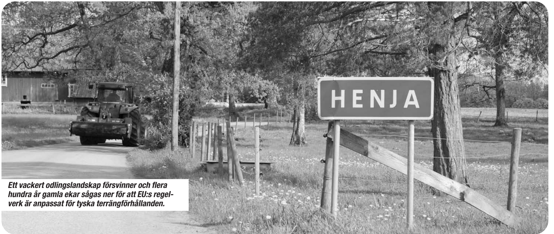
Ett vackert odlingslandskap försvinner och flera hundra år gamla ekar sågas ner för att EU:s regelverk är anpassat för tyska terrängförhållanden.