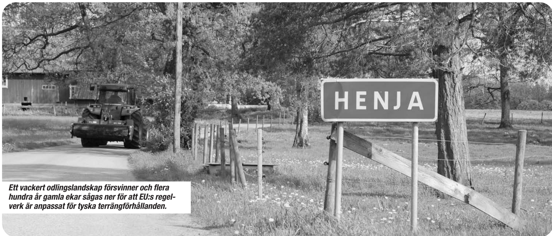
Ett vackert odlingslandskap försvinner och flera hundra år gamla ekar sågas ner för att EU:s regelverk är anpassat för tyska terrängförhållanden.