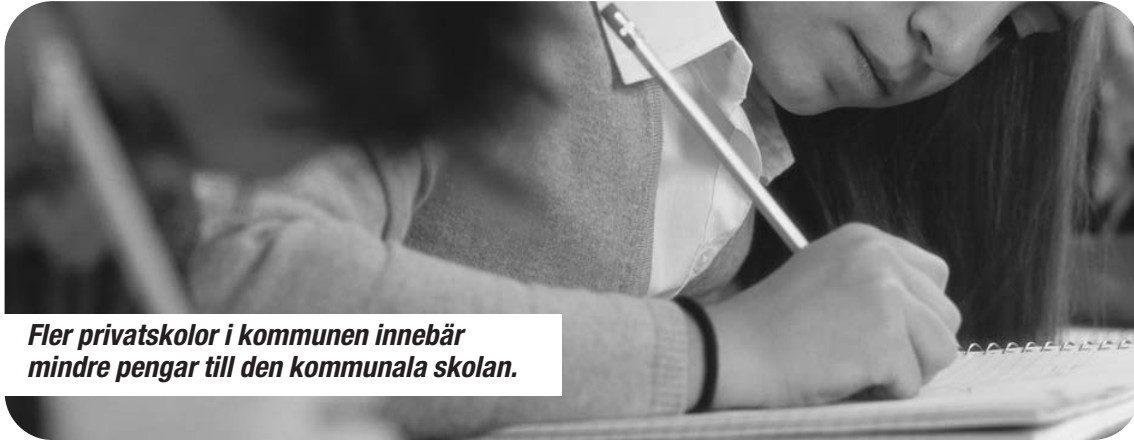
Fler privatskolor i kommunen innebär mindre pengar till den kommunala skolan.

Resultatet blir att privatskolorna utarmar de kommunala skolorna. Dels genom att privatskolorna får lika mycket offentliga medel genom skolpengen, samtidigt som de har rätt att neka elever som kan medföra stora kostnader. Och dels genom att kommunerna inte kan planera inför skol-